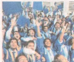
One student from IIT-Roorkee and two from IIT-Guwahati got eight-figure packages.