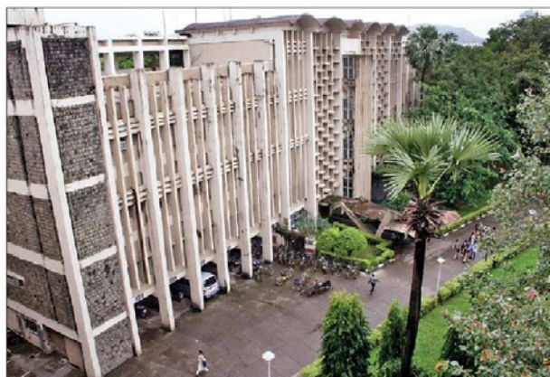
This year the institution's focus is on job quality and security

Students of the Institute have also shown an increased interest in taking up core jobs as compared to last year. There were more than 150 offers with the par-