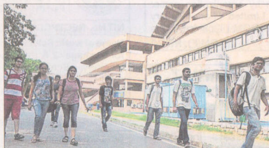
• Students at IIT Delhi.

"While the number of offers per company has gone down this year, the total