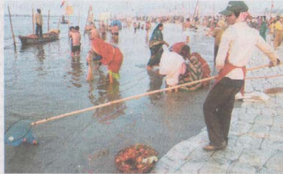
In this file photo, a sweeper collects offerings from the Ganga during Maha Kumbh Mela in Allahabad

The consortium of IITs of Bombay, Delhi, Guwahati, Kanpur, Kharagpur, Madras and Roorkee was entrusted with the task of finalising a holistic Ganga River