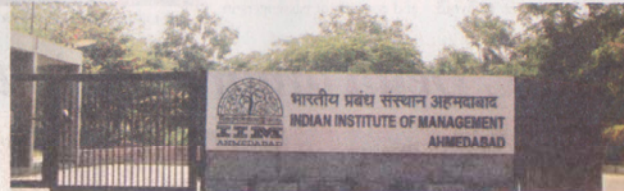
The step is another Delhi government's collaborations with premier institutions from around the world, in its bid to upgrade Delhi's government school ecosystem

The Directorate of Education, Delhi government, will enroll the principals and heads of schools for the training and send them to IIM-A in batches. As per the agreement, IIM-A will provide intensive training to all principals on school leadership. After a tie-up with the University of Cambridge, UK, and the National Institute of Education, Singapore, this is one more of the Delhi government's collaborations with pre-